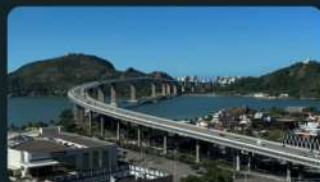
Terceira Ponte - Vitória - ES